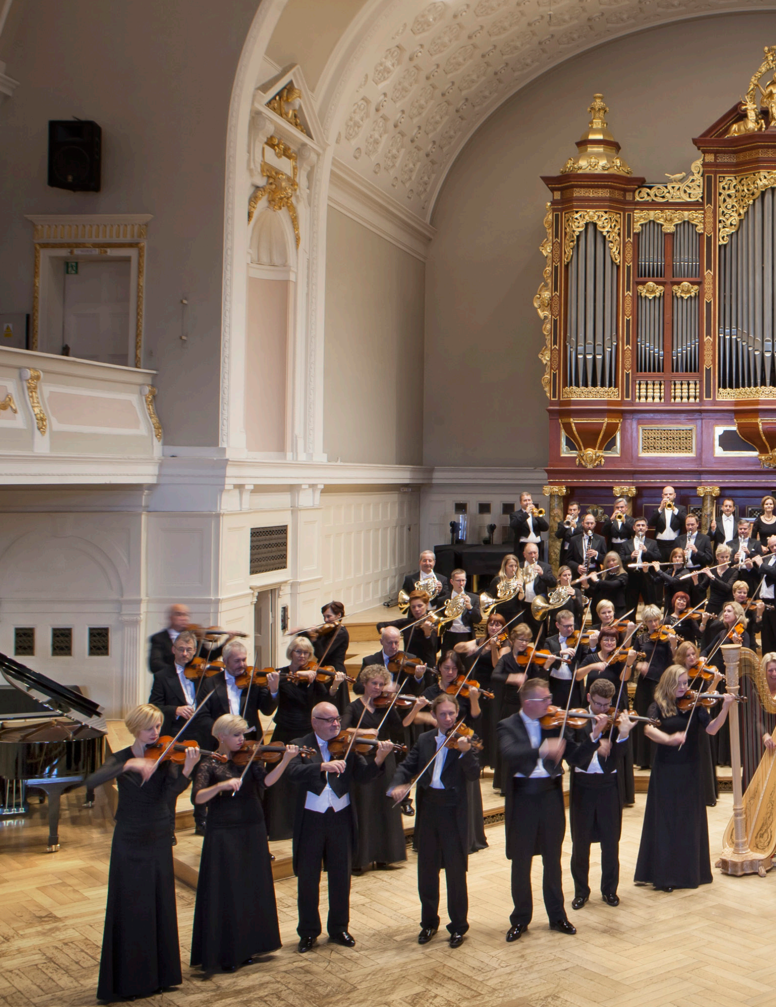
Orkiestra Filharmonii Poznańskiej Poznań Philharmonic Orchestra